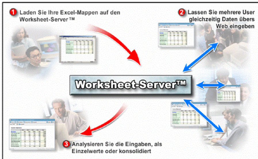
Abb. 2: Mit dem Jedox Worksheet-Server profitieren Unternehmen schnell und einfach von umfassender Excel-Funktionalität über das Web. Die plattformunabhängige Technologie bietet zudem eine hohe Anwendungssicherheit. Zahlreiche Datenbankschnittstellen lassen sich realisieren.